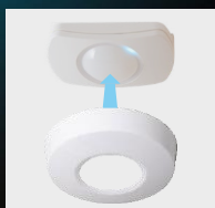
Pokrywa do montażu sufitowego