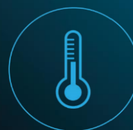
Cyfrowa kompensacja temperatury