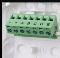
Wysuwana listwa zaciskowa