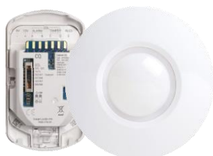
CQ – sufitowa czujka PIR

Nowa seria detektorów ruchu Capture to nasza najdoskonalsza, najbardziej niezawodna i najłatwiejsza w montażu seria czujek. Wśród detektorów Grade 2 do montażu sufitowego dostępne są czujki PIR z poczwórnym pyroelementem oraz dualne PIR + MW.