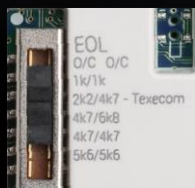
Wbudowane rezystory parametryczne