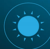
Aktywny filtr światła białego