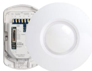
CD – sufitowa czujka dualna PIR + MW